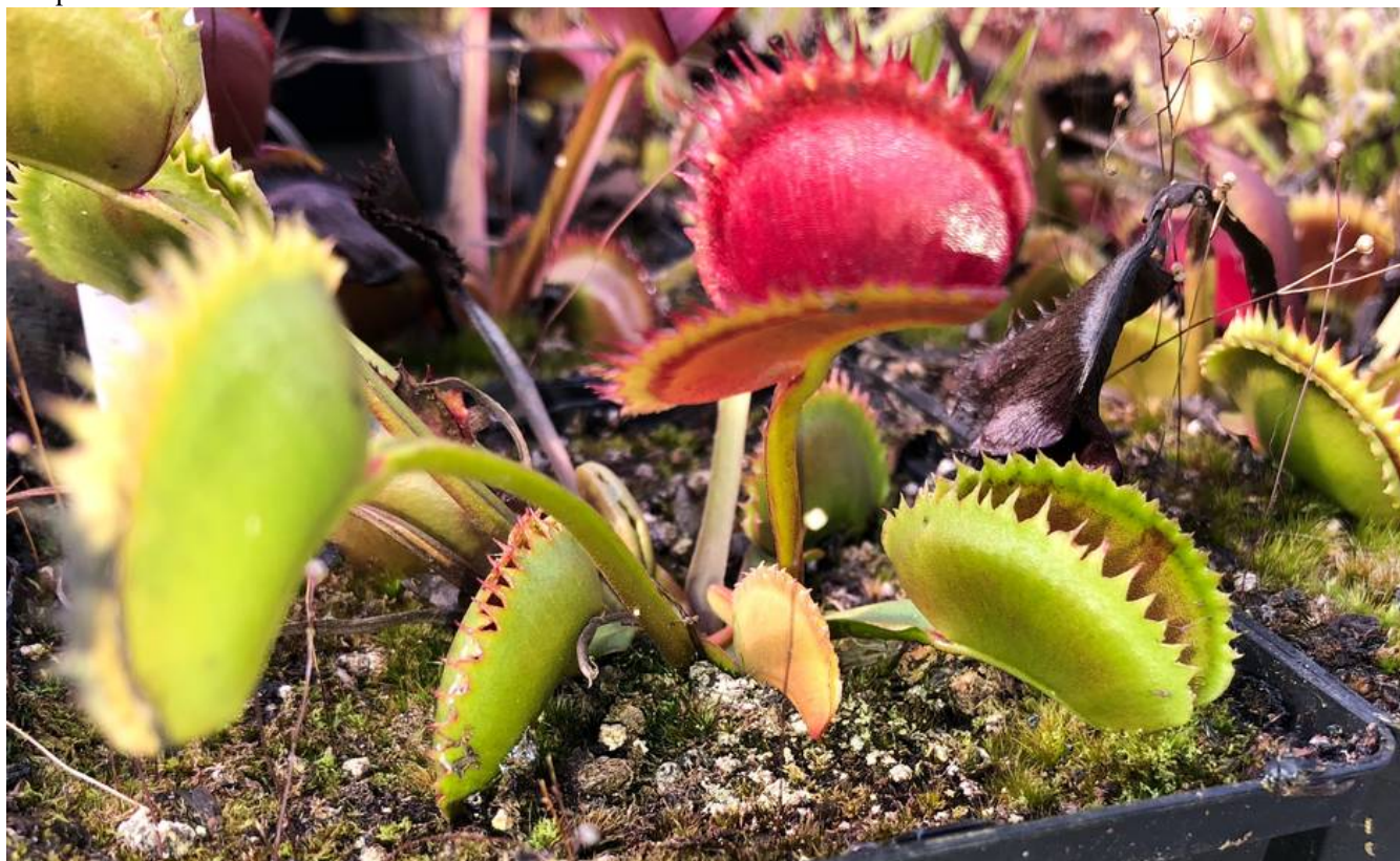
Des mâchoires de plantes carnivores : vrai piège à insectes.

Il aime toutes ses plantes, mais son petit coup de cœur va à la plante Cobra, qui fait penser à une tête de serpent. « Moins fréquente que les Droséras ou autre », admire le jeune homme. Il cultive aussi le piège naturel à frelons asiatiques : la Sarracenia. « Efficace ! »