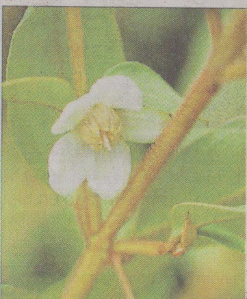
Osez la plante étrangère. Ici, un Correa « Dusky Bells », un Epimedium « Diane », un Géranium « Yannis » et un Ugni candollei .

ment ornementale, et l' Elytropus chilensis , une somptueuse grimpante rampante. Des sujets qui peuvent