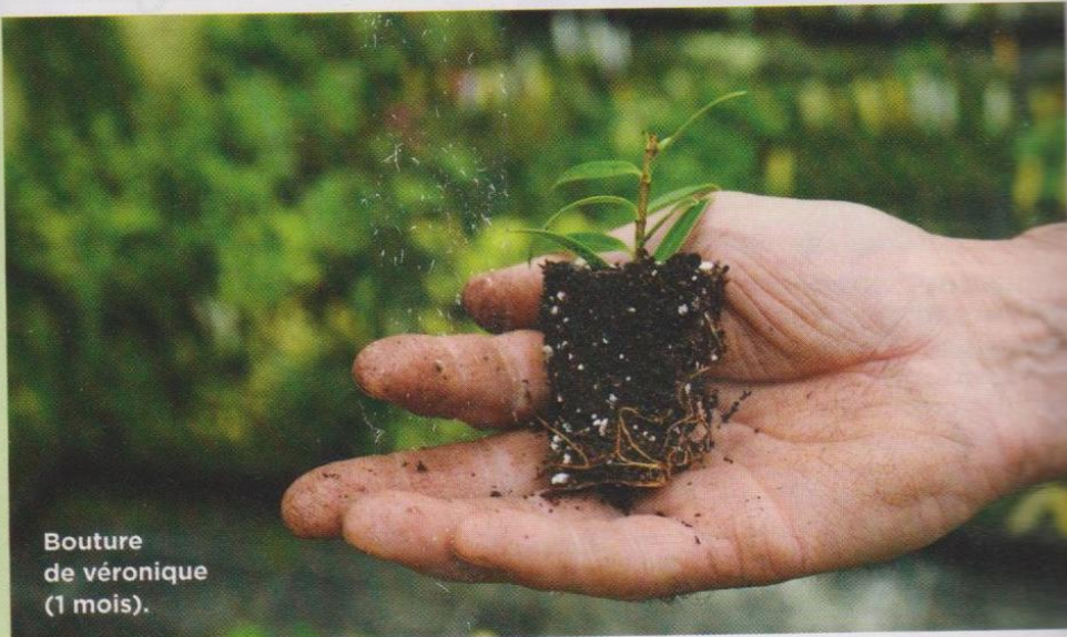
Bouture de véronique (1 mois).

Le 18 mars, Arven sera au Marché aux plantes d'Andel (Côtes d'Armor).